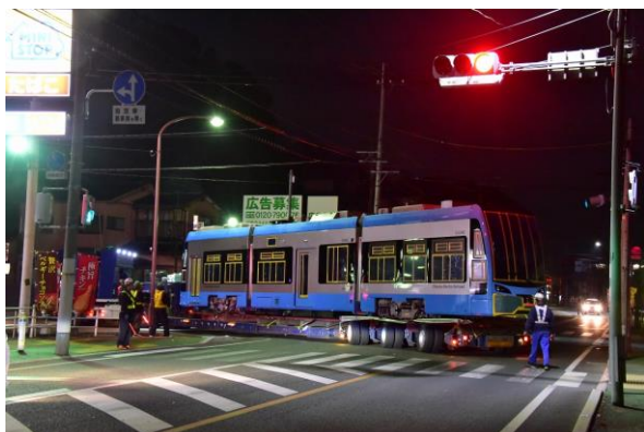
③夜間トレーラーにて一般道を走行