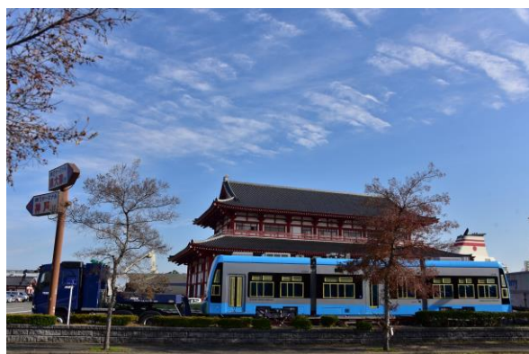
②夜間の陸送まで新門司港フェリーのりばで待機