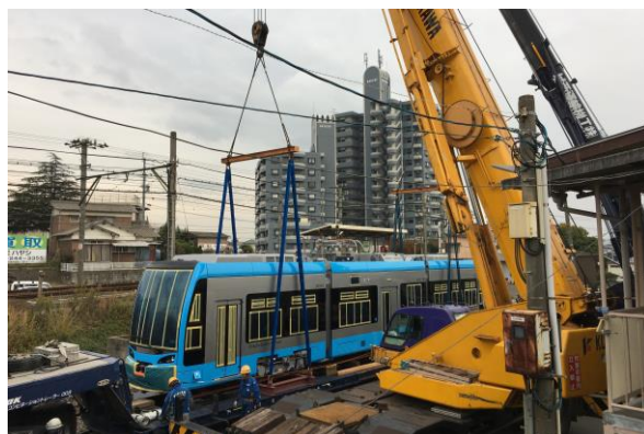
④クレーン2機を使ってトレーラーから線路へ