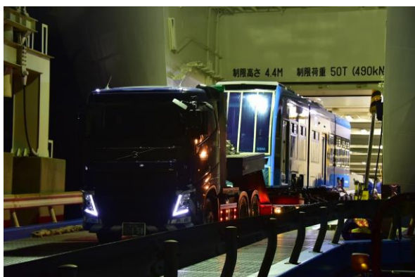
①フェリーを使って泉大津(大阪)⇒新門司港へ