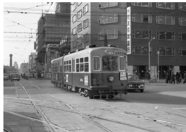
福岡市内線で活躍していた車両