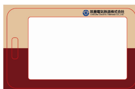
タイプ B 裏面