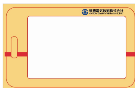
タイプ A 裏面