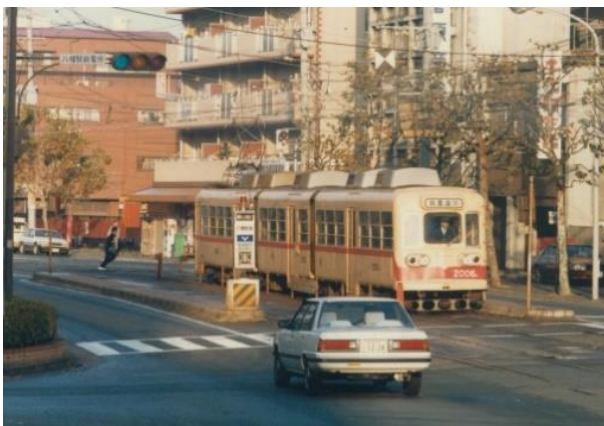
西鉄北九州線で活躍していた車両