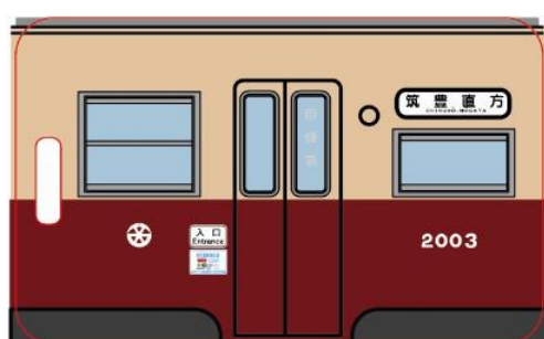
タイプ B 表面