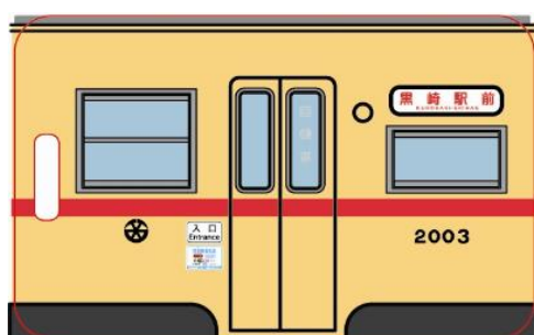
タイプ A 表面